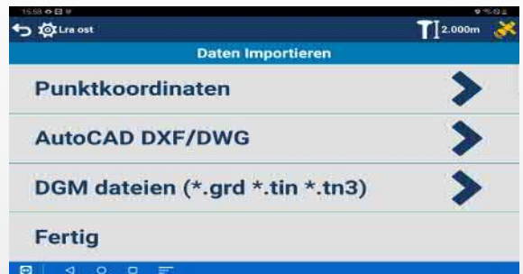
Viele Optionen für den Datenimport