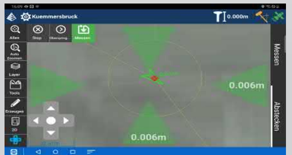
Intuitive Richtungsanzeige beim Abstecken