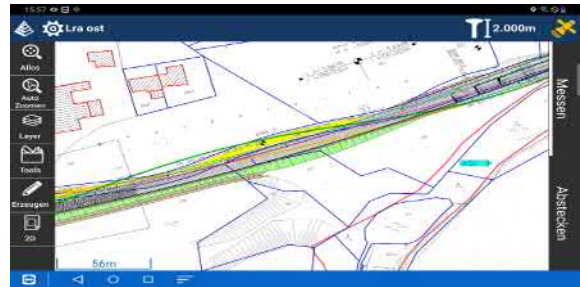
Importieren Sie CAD-Dateien im DWG oder DXF-Format