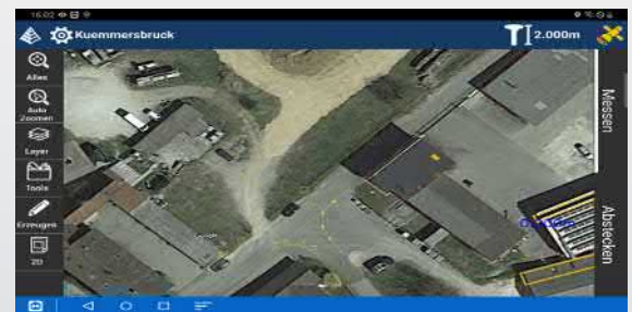
Hintergrundkarten hinzufügen - Google, OpenStreet oder WMS Dienste